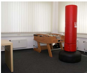
Kinder- und Jugendlichen- therapieraum